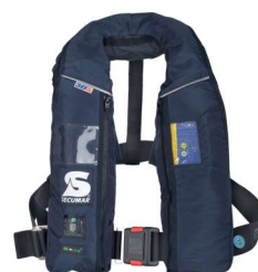
Alpha 275 AS Solas (Référence produit 14824-01)