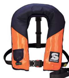
Golf 275 AS (Référence produit 13805)

Compatible pour une utilisation avec les modèles de dispositifs de flottaison personnel Secumar suivants :